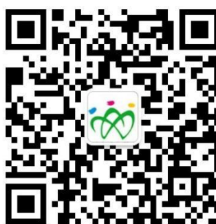
图 4：“山东就业创业导航”微信平台二维码

（一）登录。用人单位、学生扫描“山东就业创业导航”微信平台二维码（图 4）进行登录。“山东就业创业导航”微信平台对全省师范类学生（不含省属师范生）提供双选会服务。